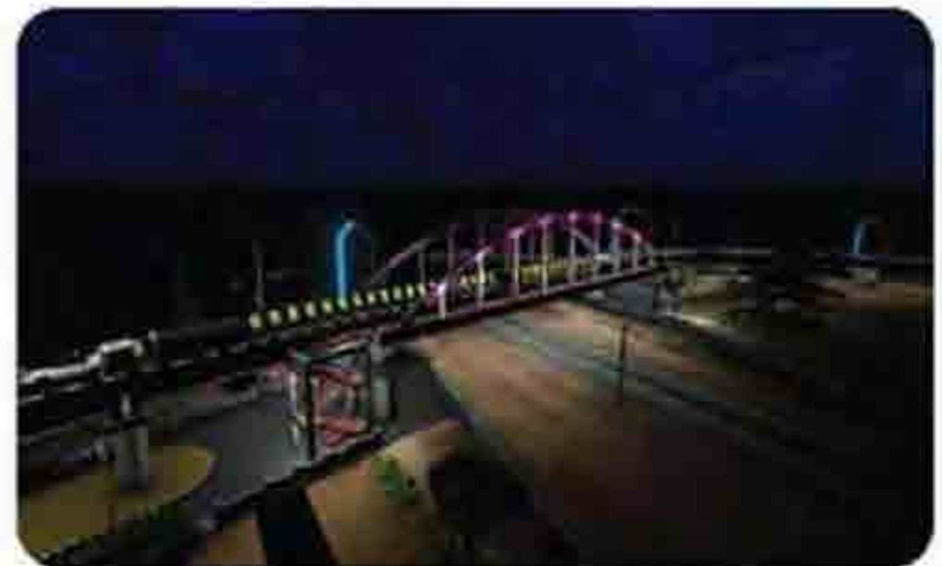
दक्षिण पूर्व मध्य रेल्वेवरील नागपूर - दुर्ग विभागातील देवरत आणि भारता रेल्वे स्थानकावापर्यान एलसी ५४८ येथील शीव दिद्रंग उड्डाणपूल