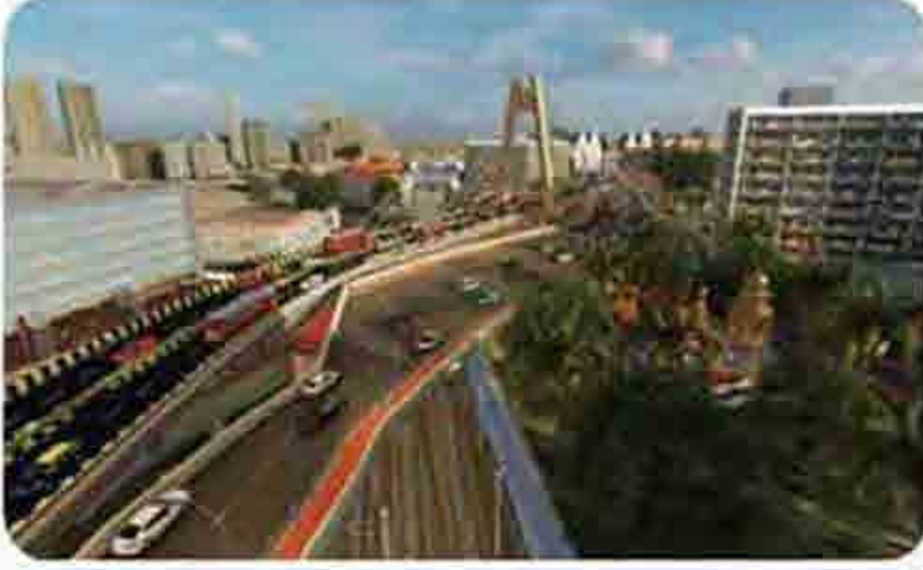
मुंबईतील भायवळ रेल्वे स्थानकाजवळील प्रस्तावित कॅबल स्टेज उड्डाणपुलाचे त्रिवीध छायाचित्र