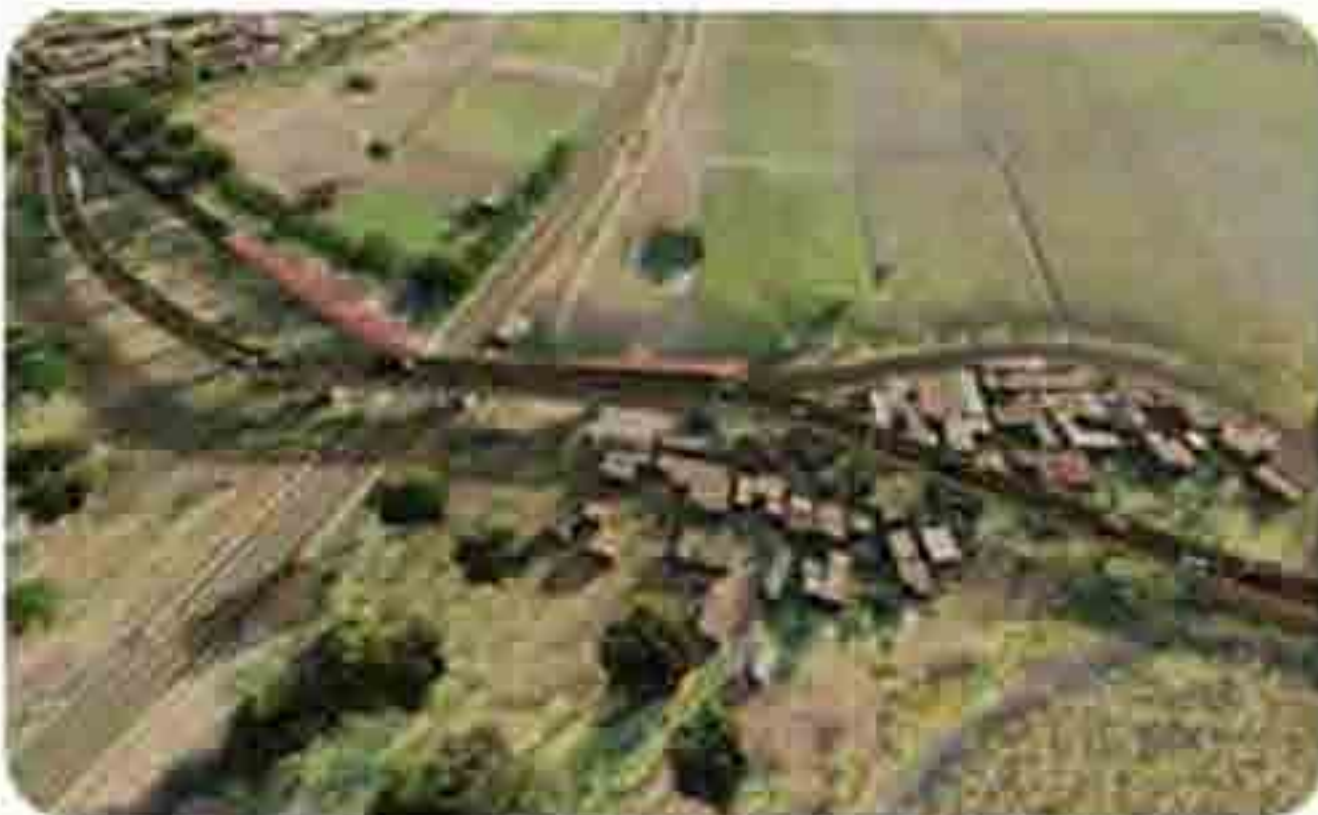
मध्य रेल्वेवरील नागपूर - समा विभागातील बोखेदी आणि सिंदी रेल्वे स्थानकावापर्यान एलसी १०८ येथील प्रस्तावित उड्डाणपूल