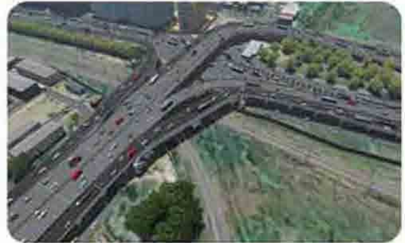
छात्री जिल्ह्यातील नवी मुंबई कालील तुर्ण येथे शिव - वनरेल महानगरावरील उड्डाणपूल संदीकरण