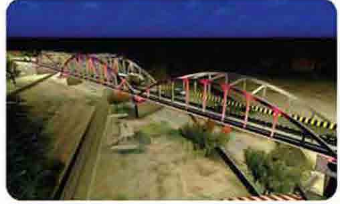
दिवोली जिल्ह्यातील दिंगोली डेस्कन रेल्वे स्थानका जवळील एलसी १४४व येथील उड्डाणपूल