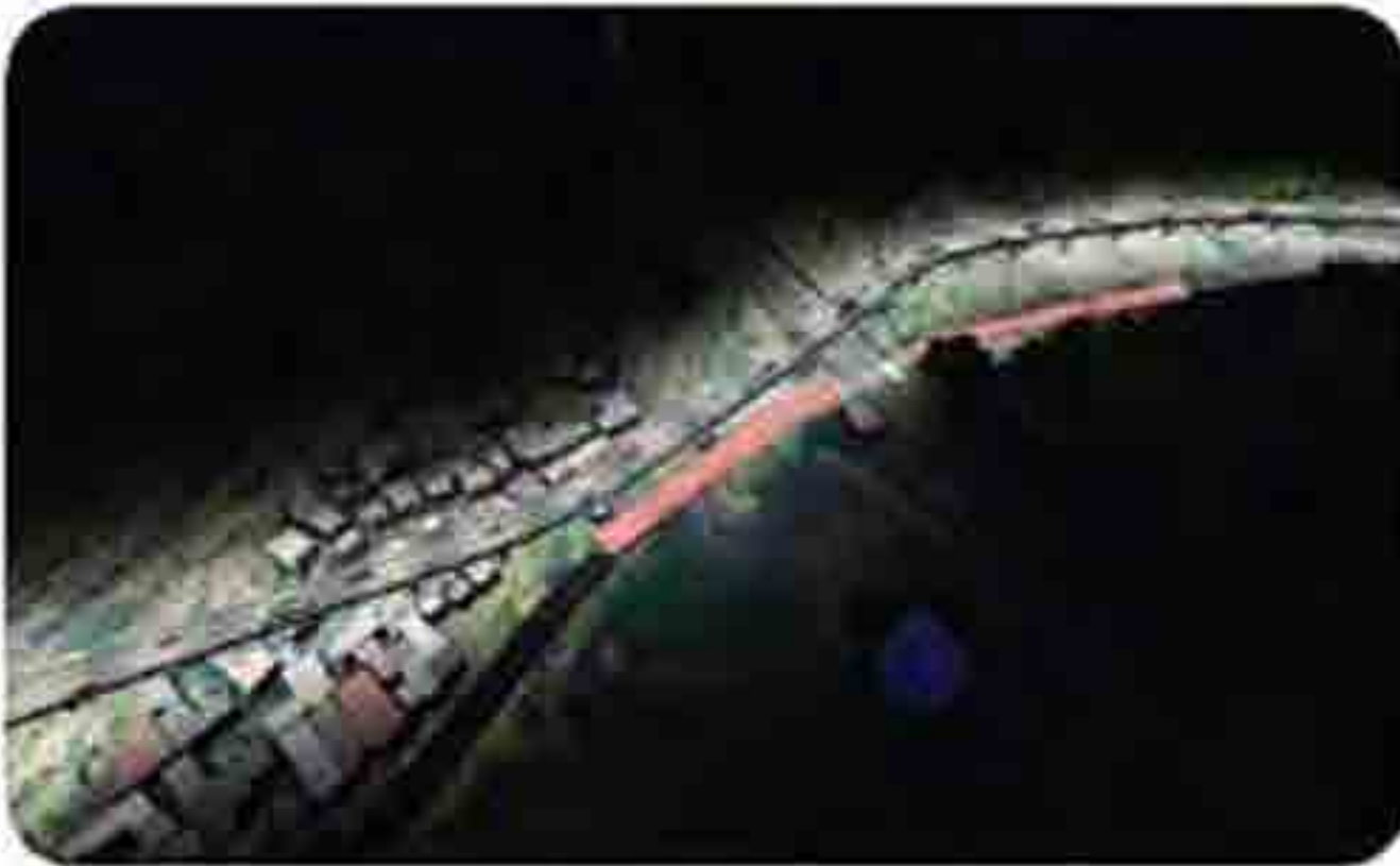
सांगली जिल्ह्यातील विरज रेल्वे स्थानकाजवळील एलसी ३६५ येथील प्रस्तावित उड्डाणपुलाचे छात्रीचे दृश्य