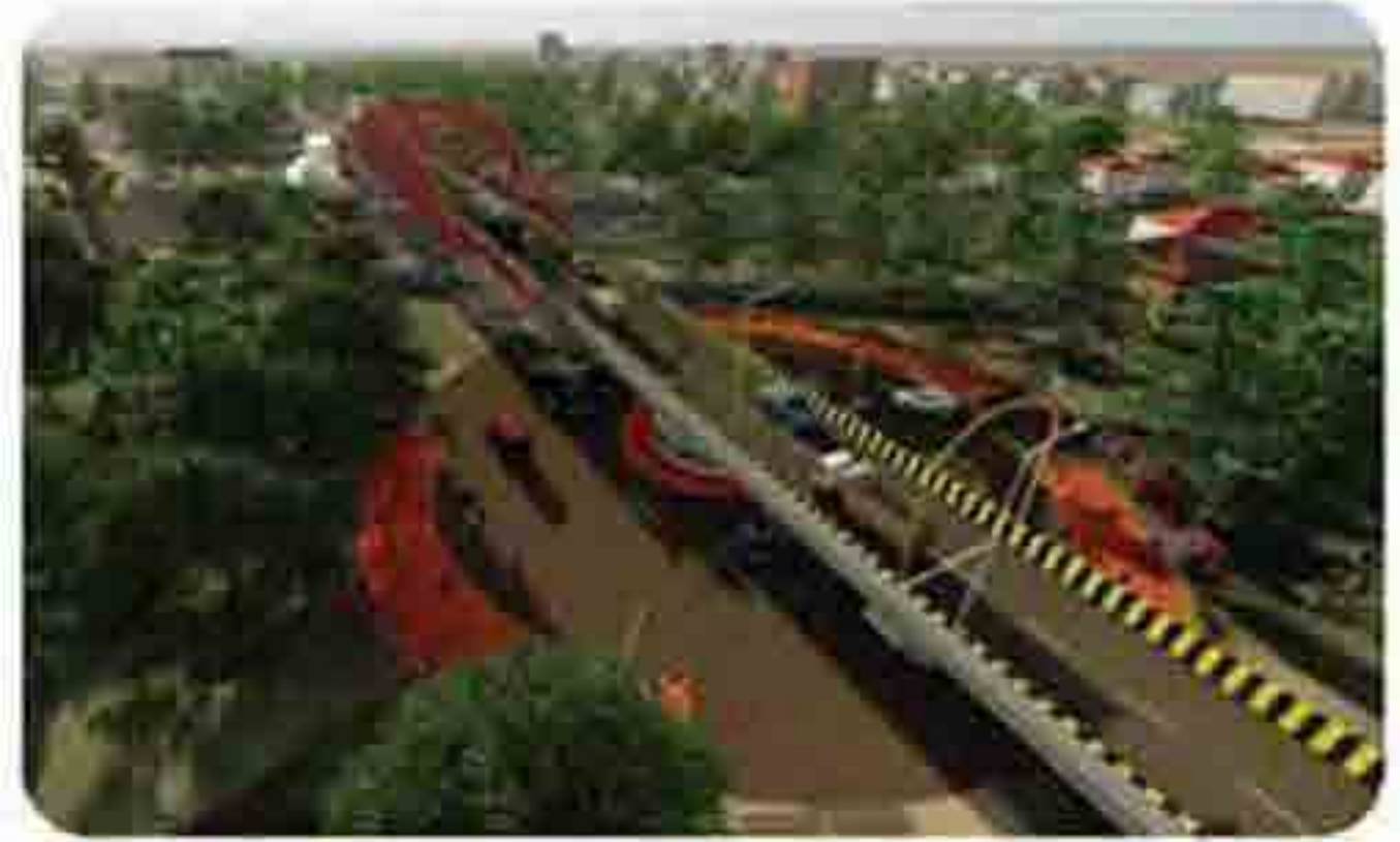
दक्षिण मध्य रेल्वेचे परनवी स्थानकाजवळील साहसगडून भुविदिद्यापीठाला जोडणाऱ्या परवागरील फाटक क्र. १२२ वी येथील प्रस्तावित उड्डाणपूल