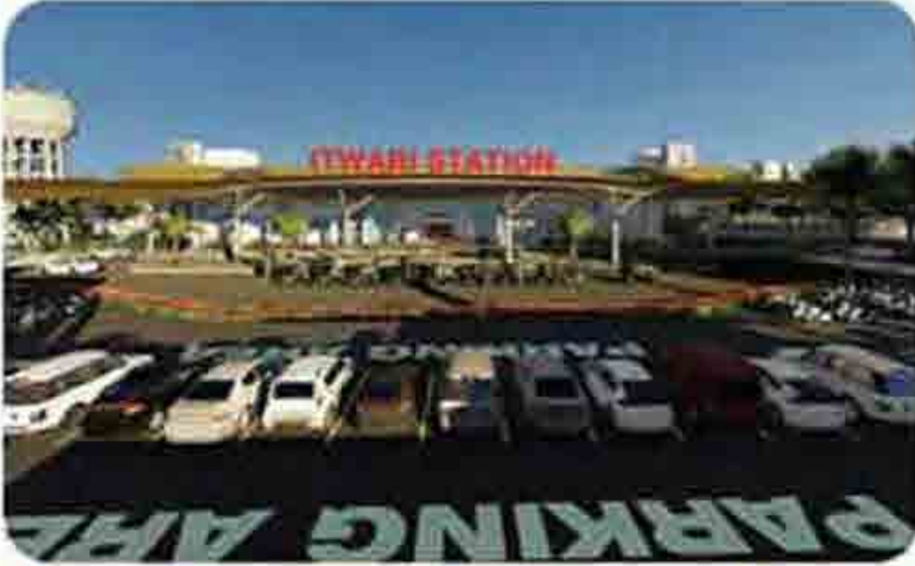
नागपूर (मुंबयी) - नागधीक मॅज कंपनीकरण प्रकल्पाचे प्रस्तावित मन्दी गॅटेल इतकारी रेल्वे स्थानक